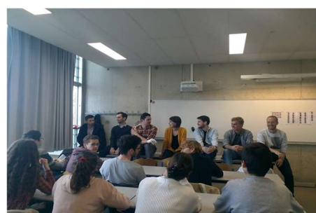
Forum des anciens 2023

La prépa des INP est une prépa intégrée qui permet, au terme de deux ans, d'entrer dans l'une des 30 écoles d'ingénieurs du groupe. Ici, pas de concours donc pas de pression (enfin...c'est relatif) ; c'est le classement en contrôle continu qui te permettra d'accéder aux écoles. La formation va t'apporter de solides connaissances en sciences, mais surtout t'éclairer dans ton choix de parcours professionnel. Le forum des Anciens, le forum des Actifs et les visios de présentation d'écoles t'aident à te projeter, à te discuter avec des anciens et à avoir des exemples concrets.