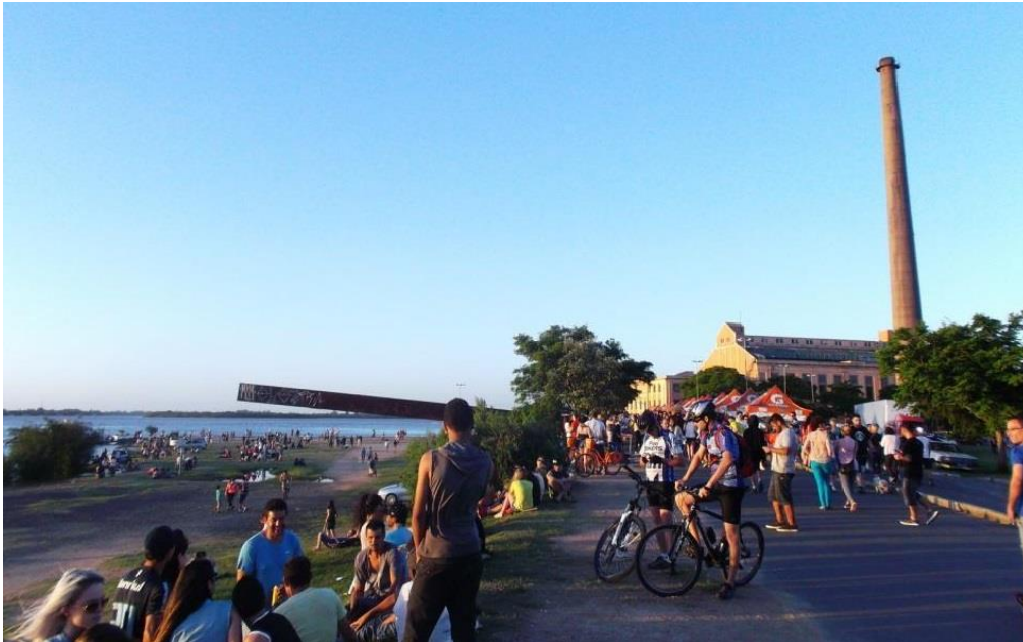
Campus de l'UFRGS

L'UFRGS est une université fédérale située principalement à Porto Alegre, capitale de l'État du Rio Grande do Sul et ville très européenne d'un point de vue architectural et organisationnel et climatique. Avec environ 35000 étudiants, l'UFRGS est l'une des meilleures universités brésiliennes, notamment en informatique et génie industriel.