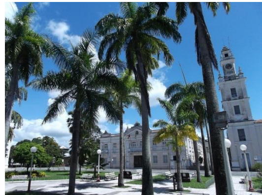
Campus de l'UFPE

Son université (UFPE) est très dynamique, et les contacts sont en train de s'établir notamment avec le département de génie industriel qui a été évalué ces dernières années comme au premier rang national, ex-aequo avec celui de l'UFRGS. Deux villes et climats très différents avec des notoriétés en génie industriel reconnues.