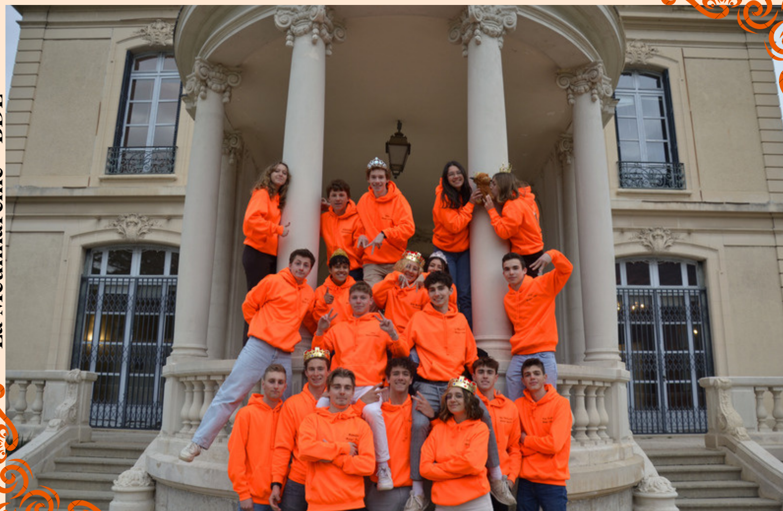
La Meuhnarchie - BDE

Et ça c'est le BDE au grand complet ! 19 membres de la Meuhnarchie, la liste gagnante des campagnes 2023 à votre service désormais, pour les entretiens, les soirées et en général l'année prochaine !