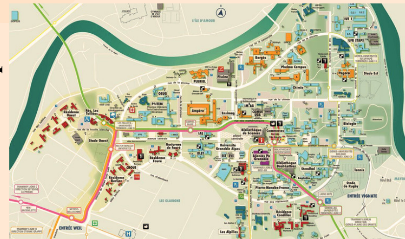
Plan du campus