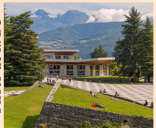
Photo de la BU

Et bien sûr, existe la place forte du travail étudiant : la Bibliothèque Universitaire, située à 5 minutes de la Prépa, où les plus courageux pourront bosser jusqu'à 22h dans une ambiance studieuse. Il est même possible d'y réserver une salle, l'idéal pour aller travailler à plusieurs sans déranger les autres!